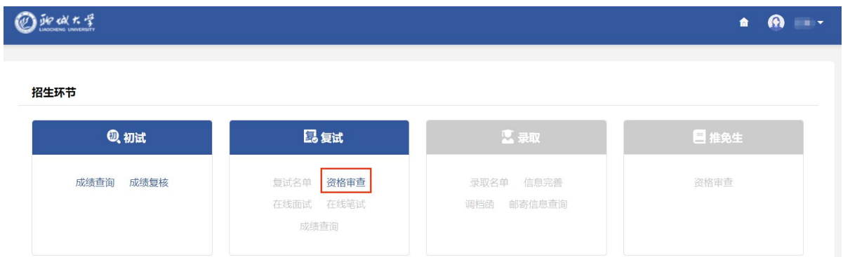
提交材料功能位置